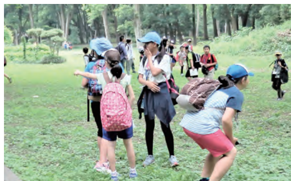
チェックポイントはどこだ!!