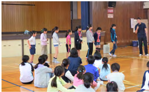
緊張のリーダー候補生

緊張した雰囲気の中、開会式が行われ、まずは「子ども会とは何か、リーダーになるために必要な心構え」などの講話がありました。