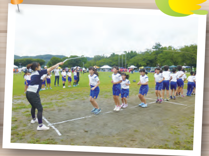
平成29年度スポーツ大会風景