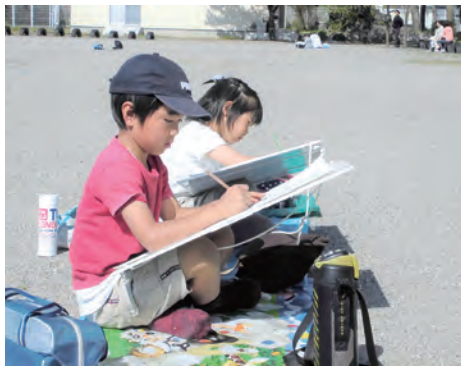
真剣に絵を描く子供たち