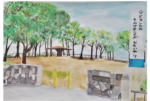
*** 教育長賞の作品 ***