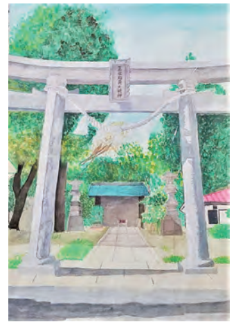
*** 市長賞の作品 ***