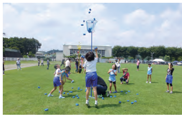
たくさん入ったかな？

一人一人が忘れられない夏の思い出になりました。大会開催にあたり、準備、審判などにご協力いただいた各校区の皆様に感謝申し上げます。大会結果は以下の通りです。