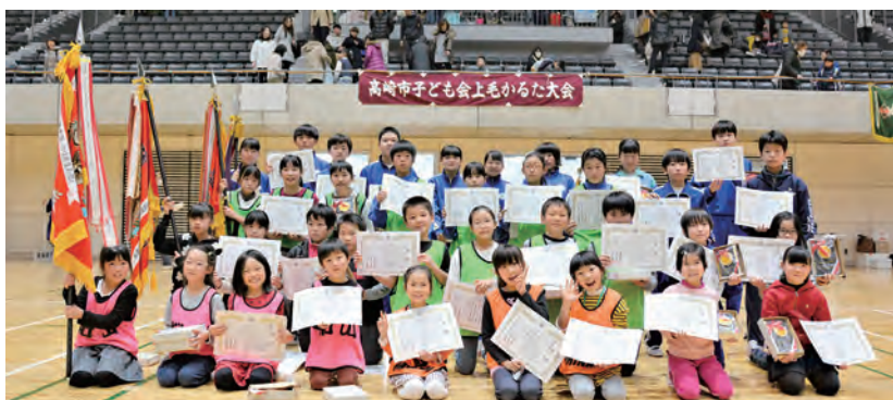
県大会出場者(一・二年の部を除く)