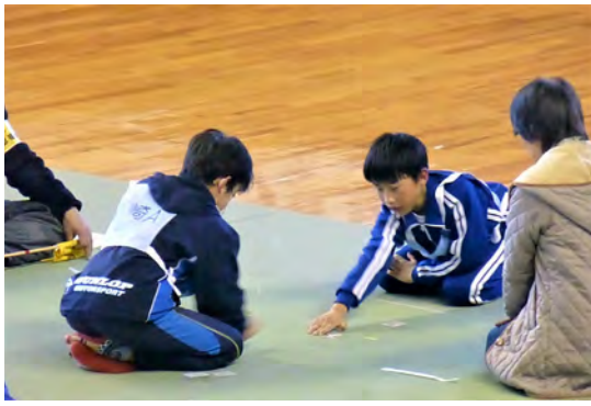
決勝リーグでの高崎市対決!!

高崎市代表として出場した選手は、それぞれの部門とも健闘し、個人戦2部門で優勝を飾りました。お疲れさまでした。各部門の入賞者は以下の通りです。