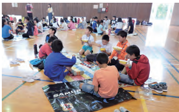
お待ちかねのカレーライス!!

その後は育成指導者となる大人も交えてのレクリエーションです。目的はたくさんの人と話すこと、一人でも多くの人の顔と名前を覚えること。自己紹介じゃんけんを繰り返すうちに違う校区の参加者同士が自然と言葉を交わり、緊張していた雰囲気が少しずつ和んでいきました。みんな笑顔に