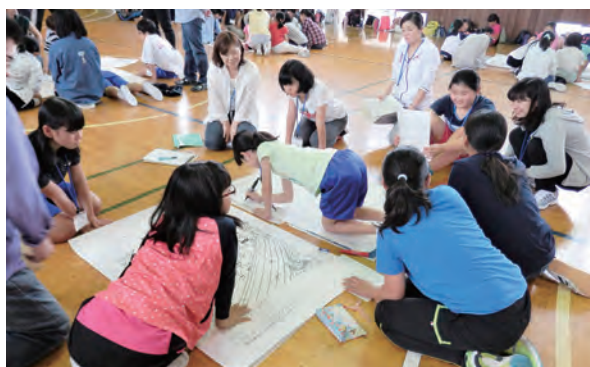
KYTで危険箇所を出し合う子供たち

午後はKYT(危険予知トレーニング)と安全教育ということ、初めに活動の意義とやり方を学びました。次にグループの中から選ばれたリーダーと書記を中心に、危険箇所が潜むイラストシートを広げて意見を出し合いました。限られた時間で話し合った結果を模造紙にまとめるのは忙しい頃にはこの後一緒に活動することになるグループが出来上がりました。