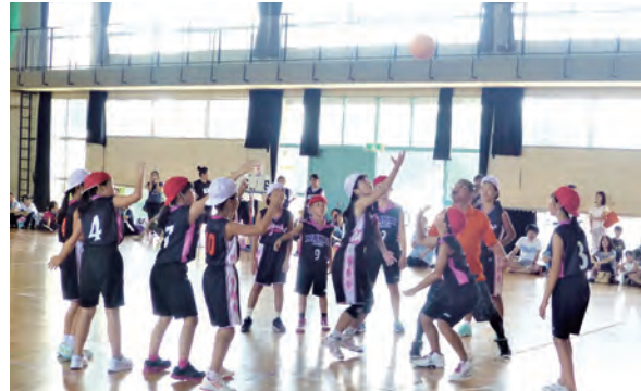
ボールはもらった!!