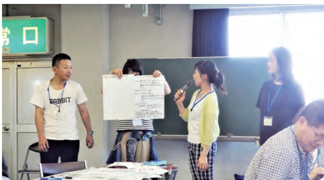
→討議結果のグループ発表

次に、後期日程にて子どもたちを青年センターから群馬の森まで引率するにあたり、KYTを踏まえてルートの確認や危険箇所の周知などを話し合いました。各グループで様々な意見や注意すべき点を発表しました。子どもたちに考えさせること、大人の役目はあまり口を出さず目を離さないこと等、子どもの自立を促すことはとても難しいと感じました。指導していただいた講師の皆様、ありがとうございました。