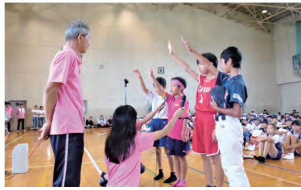
全選手の気持ちを込めて宣誓

昨年同様、ソフトボール、ポーツボール、ドッジボール、長縄跳びに加えエキシビジョンとして玉入れと五人制長縄跳びを行いました。